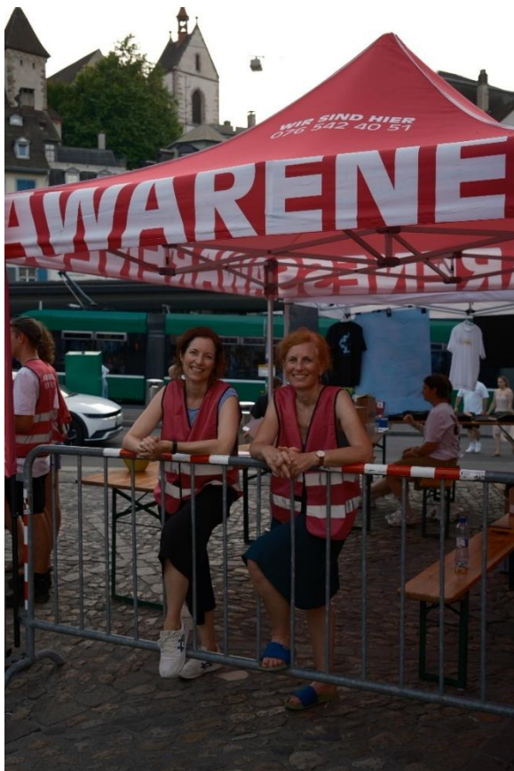
Das Team der Opferhilfe beim Awarenesszelt