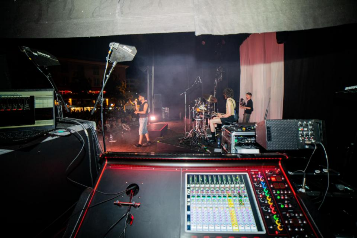
Backstage-Sicht auf die Hauptbühne während des Headliners "Soukey"