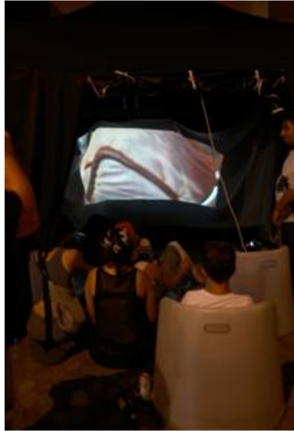
«ground x core» von Phil Kougias und Fiona Nhieu