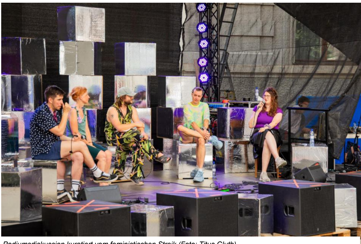
Podiumsdiskussion kuratiert vom feministischen Streik