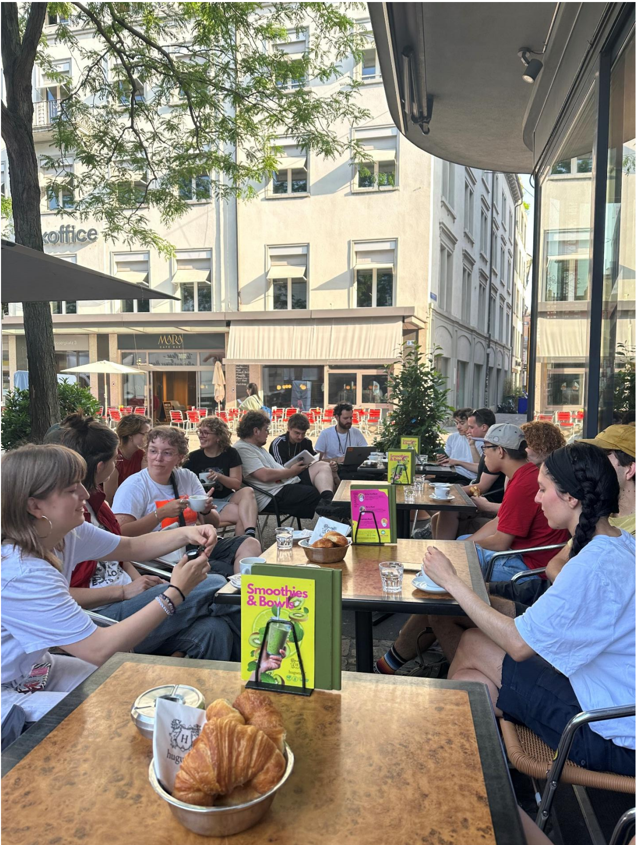
imagine ist Gemeinschaft