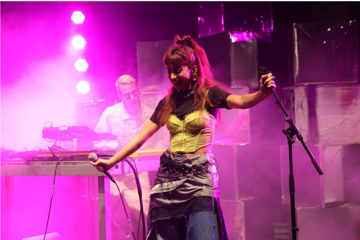
Tales & Ahlam auf der selbstgestalteten Bühne im Klosterhof