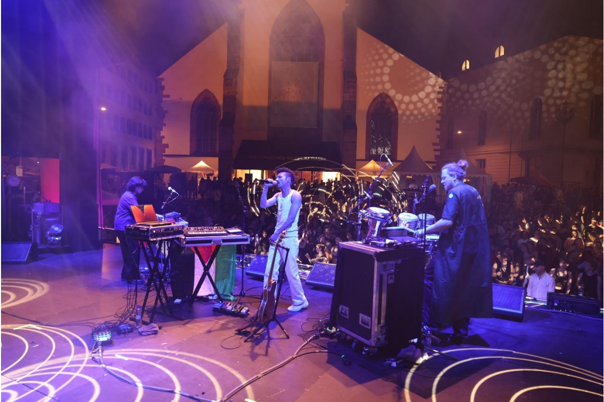
Sicht auf den Barfüsserplatz von der Bühne aus während Sami Galbi