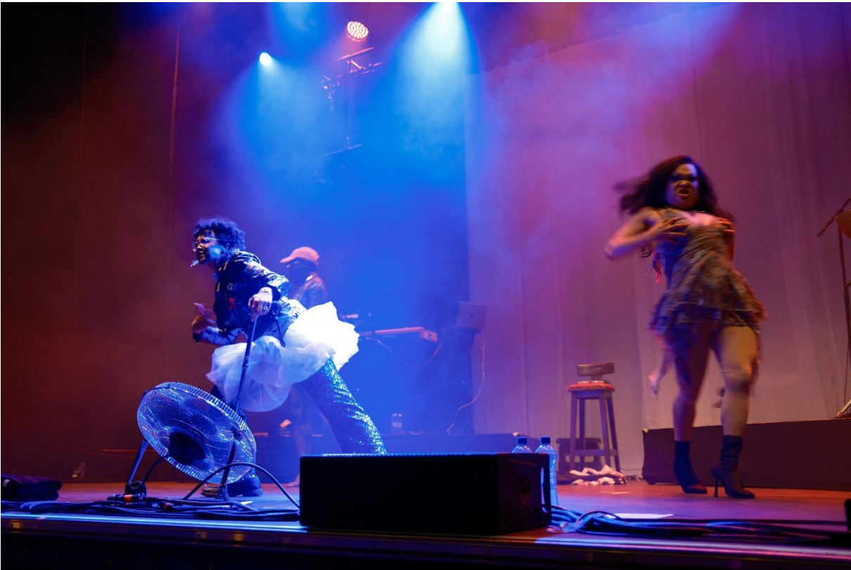
Drag Show am Samstag auf der Barfi Bühne