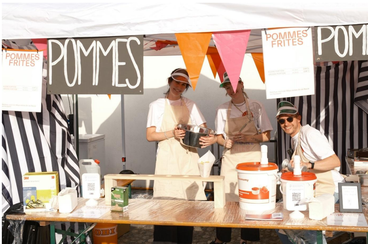
Aufbau des imagine eigenen Pommes-Stands

Wir sind dankbar für alle Freund*innen und Unterstützer*innen des imagine. Ohne sie wäre das Festival auf dem Barfüsserplatz nicht denkbar. Mit eurer Hilfe blicken wir voller Vorfreude auf das kommende Projektjahr.