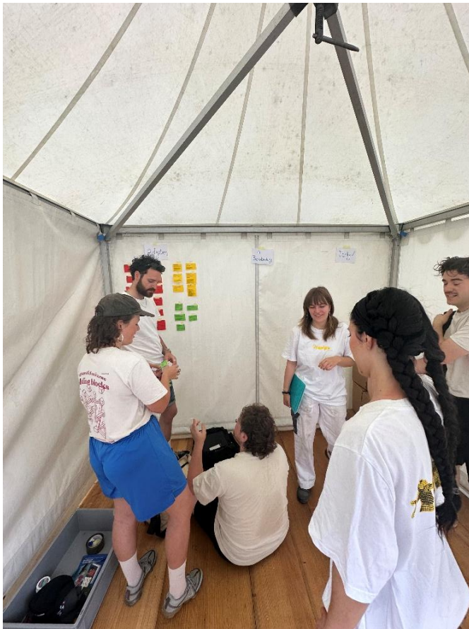
Ein Teil des imagine bei der Aufgabenverteilung

Durch das gemeinsame Organisieren, Planen und Erarbeiten von Inhalten haben die Beteiligten – wir – Fähigkeiten in Projektmanagement und -planung, das Tragen und das Teilen von Verantwortung, Zusammenarbeit mit unterschiedlichen Menschen, Problemlösung und vieles mehr gelernt. Daneben wird sich mit Themen von gesellschaftlicher Ungleichheit auseinandergesetzt, durch Erarbeitung der Jahresthematik und des Sensibilisierungsprogramms, aber auch mit Entscheidungen wie – wer erhält Platz auf der Bühne? – oder alltäglichen Dynamiken – wo zeigen sich sexistische, rassistische oder ableistische Machstrukturen in unserem Zusammenarbeiten als Team und Gruppe von jungen Menschen?