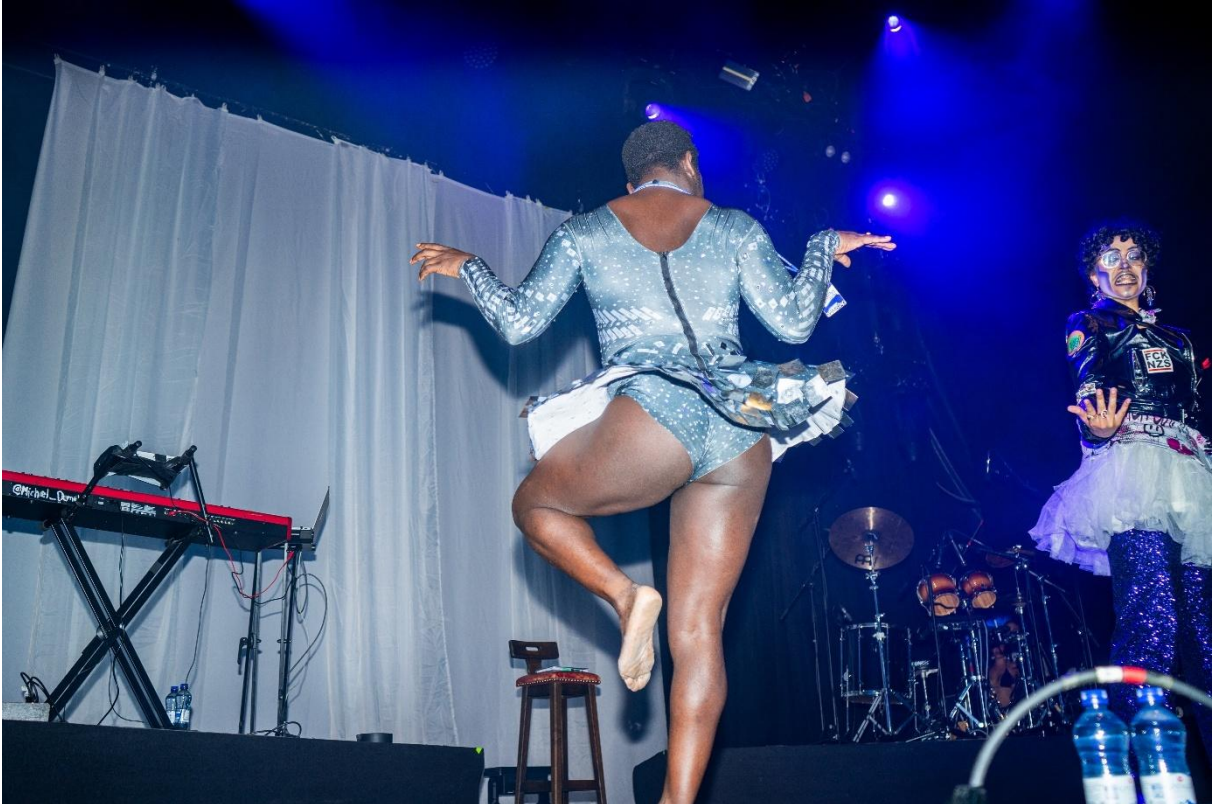
Drag-Show am imagine 2025